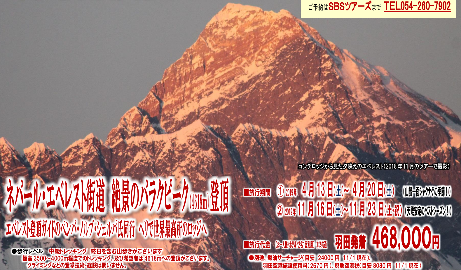
コンデロジから見た夕映えのエベレスト(2018年11月のツアーで撮影)