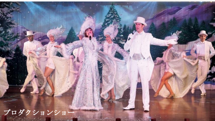
プロダクションショー