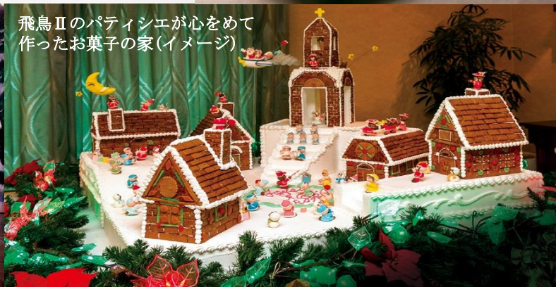
飛鳥IIのパティシエが心めて作ったお菓子の家(イメージ)