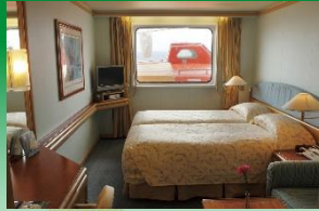
Kステート (視界が遮られます)