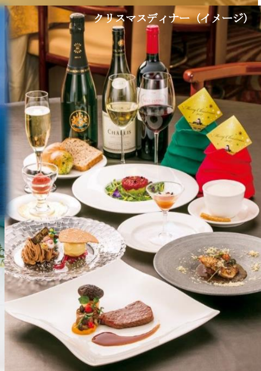
クリスマスディナー (イメージ)