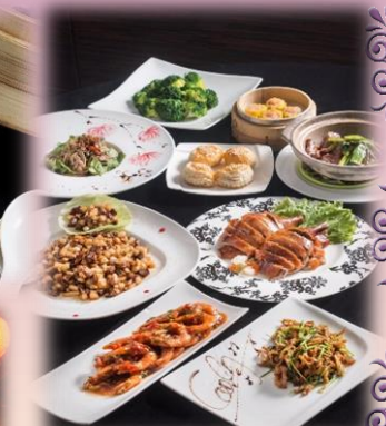
SBSツアーズオリジナルメニューイメージ