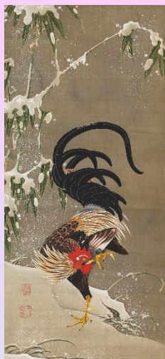
伊藤若冲 「花卉雄鶏図」(部分) 岡田美術館蔵