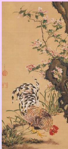
伊藤若冲 「雪中雄鶏図」(部分)