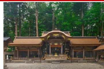
諏訪大社上社(イメージ)