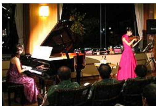
ロビーコンサート(イメージ)