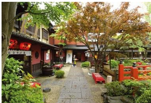
とうふ屋うかい外観イメージ