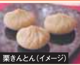
栗きんとん(イメージ)