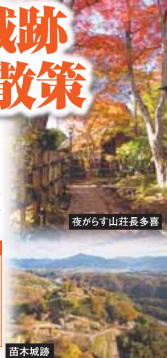
夜がらす山荘長多喜