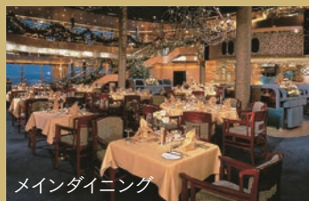
メインダイニング

世界で最も影響力のある料理人たちが活躍するホーランドアメリカラインのお食事。3つ星レストランの料理長からテレビの料理ショーで活躍するホスト料理人まで、多彩なメンバーが監修する料理は、味はもちろん、創造性、プレゼンテーションともに一流です。