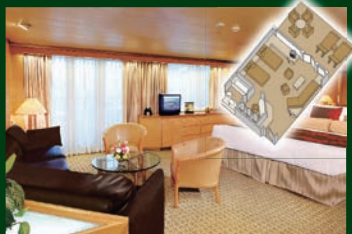
ネプチューンスイート

ロングクルーズを意識した客船は一般的なプレミアムクラス客船の中でも広く作られており、高級なマットレスや柔らかなシーツを使用したベッドで快適なクルーズをお楽しみいただけます。