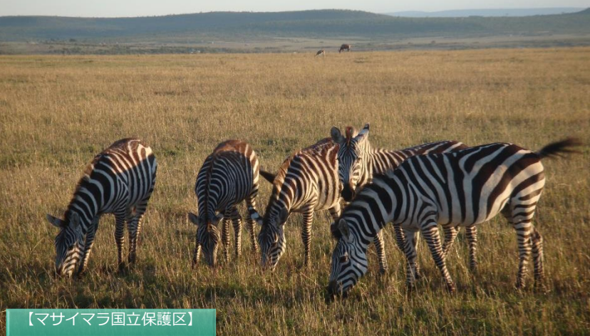
【マサイマラ国立保護区】