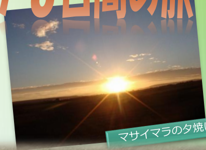
マサイマラの夕焼け