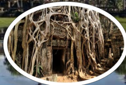
タブローム(イメージ)