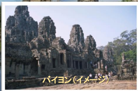
バイヨン(イメージ)