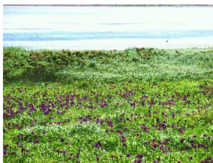
(野付半島イメージ)