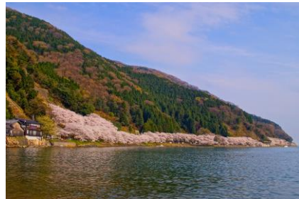
〔海津の桜イメージ〕

白洲正子の随筆「かくれ里」に掲載された「神子（みこ）の山桜」を訪ねます。福井県若狭町の三方五湖のひとつ水月湖から若狭湾に突き出た常神半島へ、神子の集落に至る峠を越えると、山の斜面を覆い、まるで海に落ちるかのよう咲く山桜。春にこそ訪ねてみたい「かくれ里」です。