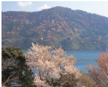
〔神子の桜イメージ〕