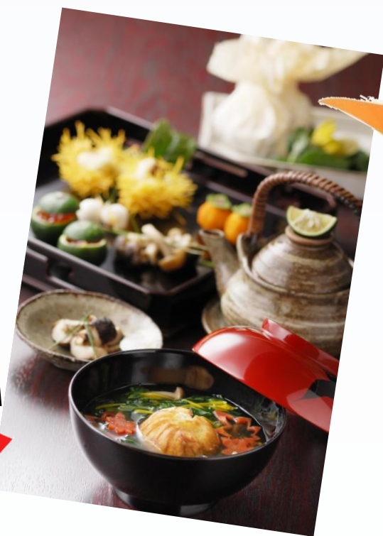
夜がらす山荘長多喜 秋の食材を使った茶懐石 (イメージ)

国指定史跡の山城、苗木城。 天守跡に設けられた 展望台からの景色は素晴らしく 360°見渡せる秋の絶景が広がります。昼食は日本昔話の世界に入りこんだような古民家にて秋の食材を使った目にも美しい懐石料理をご堪能頂きます。