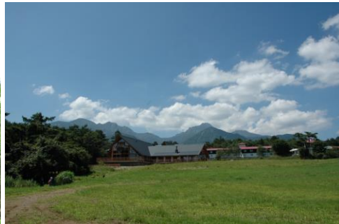
【清泉寮とハヶ岳イメージ】