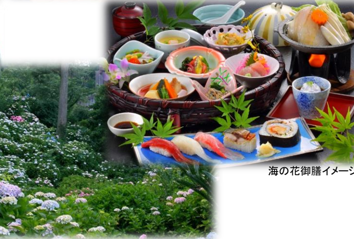
海の花御膳イメージ