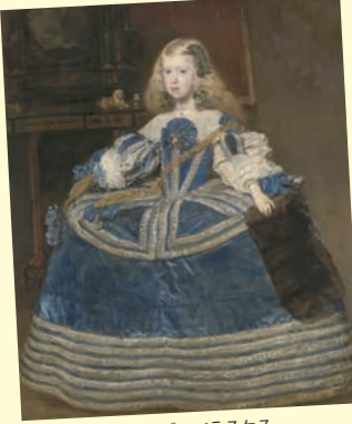
ディエゴ・ベラスケス 《青いドレスの女王マルガリータ・テレサ》 1659年油彩/カンヴァス ウィーン美術史美術館

★現在世界で唯一、名家が国名になっているリヒテンシュタイン侯国は今年建国300年を迎えます。リヒテンシュタイン侯爵家は代々領地経営に成功した富で積極的に美術品を収集し、その華麗さが宝石箱に例えられるほど!!その優雅さが貴族の宮殿空間へ誘うこと間違いありません!! ★ご昼食は、明治から上野で腕を振ってきた洋食店「黒船亭」でSBSオリジナルメニューをご賞味♪ノスタルジックな街・上野で伝統の味を楽しめば、なんだか懐かしい気持ちが胸に広がります。 ★約650年続いたハプスブルク家の歴史。世界屈指ともいわれるコレクションの中から約100点が来日します。歴史そのものを軸とした構成で、同家の人々や歴史の紹介を織り交ぜながら、時代ごとの収集の傾向などについても紹介します。