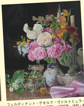
フェルディナント・ゲオルク・ヴァルトミューラー 《磁器の花瓶の花、舞台、銀器》 1839年、油彩・板 所蔵：リヒテンシュタイン侯爵家コレクション、アドルフ・グライム © LIECHTENSTEIN, The Princely Collections, Vaduz-Vienna

焼津駅・静岡駅・清水駅・富士IC[6:30-8:00]＝浜谷出口 Bunkamuraザ・ミュージアムにて「ヨーロッパの宝石箱リヒテンシュタイン 侯爵家の至宝展」鑑賞 明治から続く老舗洋食店「黒船亭」にてSBSオリジナルランチ♪ 国立西洋美術館にて「日本・オーストリア友好150周年記念 ハプスブルク展 600年にわたる帝国コレクションの歴史」鑑賞 上野入口＝富士IC・清水駅・静岡駅・焼津駅[17:50-19:20頃]