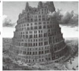
ピーテル・ブリューゲル1世《バベルの塔》1568年頃 油彩、板

東京都美術館では24年振りの来日となる「バベルの塔」16世紀ネーデルランドの絵画、版画、彫刻など約90点の出品作をたっぷり鑑賞。2016年にオープンしたすみだ北斎美術館も訪れます。▽6/9▽焼津駅7時、静岡駅、清水駅、富士IC、沼津IC9時▽上野ICー東京都美術館にて「バベルの塔」展鑑賞ー浅草ビューホテル「武蔵」にてブッフェランチー2016年11月22日にオープンしたすみだ北斎美術館ー駒形ICー各地(18時30分～20時20分)▽旅行代金14,800円(昼食付)