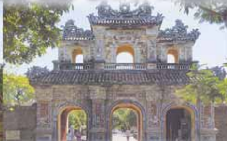
フエ グエン朝王宮