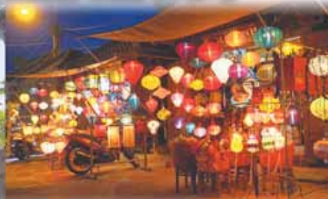
ホイアン ランタンナイトマーケット